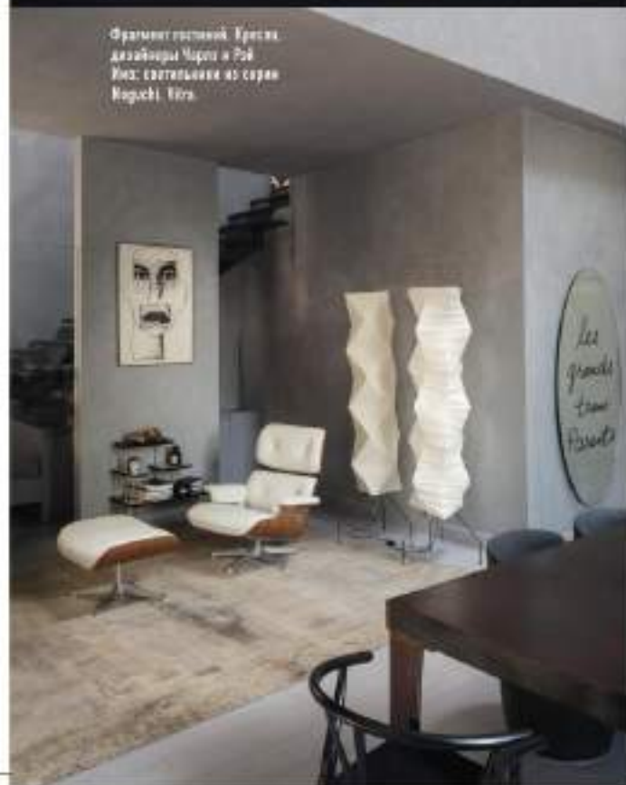
Фрагмент гостиной. Кресла дизайнера Чарли и Рэй Мис; ваза-скульпка из серы Naguchi, 1970.

» выключенное или затмившись. Но один объект, несмотря на его серый цвет, сильно выделяется среди прочих. Это носорог, подвешенный под потолком между зоной гостиной и столовой. Он, кстати, был первым арт-объектом, предложенным Паолой Моретти хозяйке, с него-то и началась коллекция искусства для этого дома. «Я думаю, что носорог идеально подходит для гостиной с высокими потолками и полностью вписывается в структуру, которую формируют металлические перекрытия, они будто обрамляют этот стоп-кадр зашпигованного в вакууме тела», — комментирует Паола Моретти.