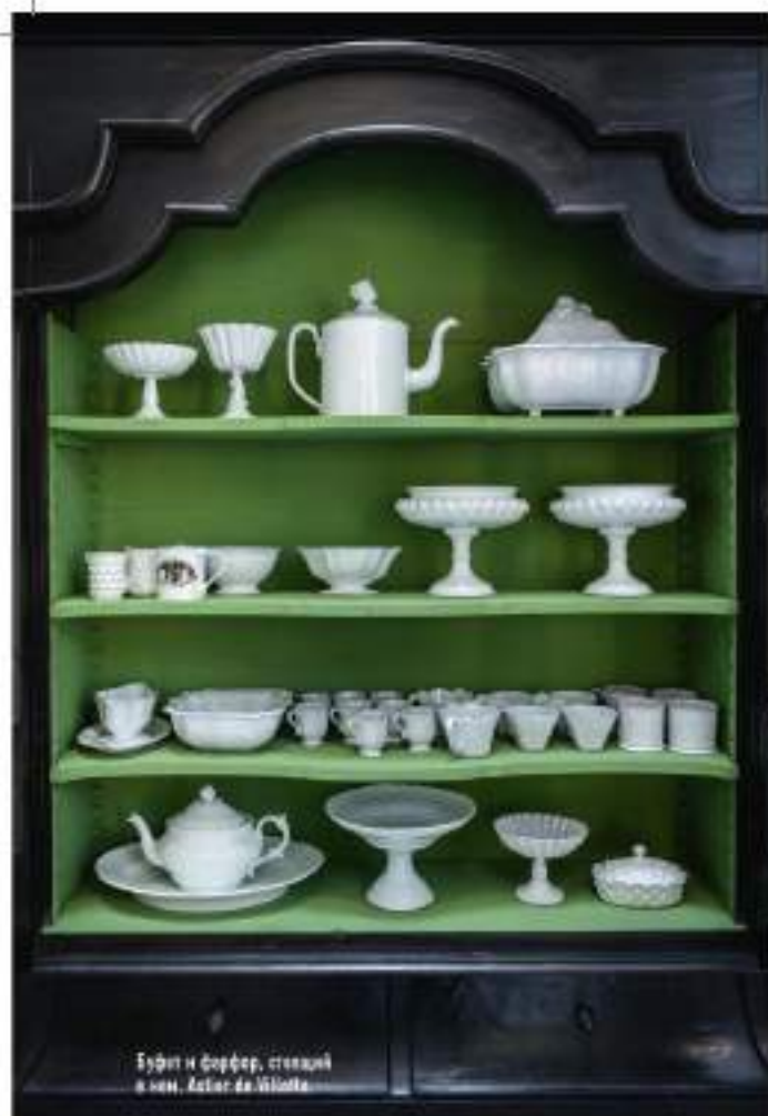
Буфет и фарфор, сделаны в нем. Автор: де Вильде