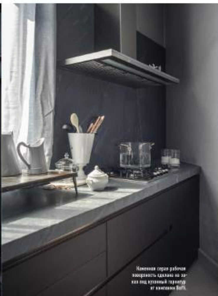
Намечена серая рабочая зона: серая сделана на за- каз под круглый гарнитур от компании Boft.