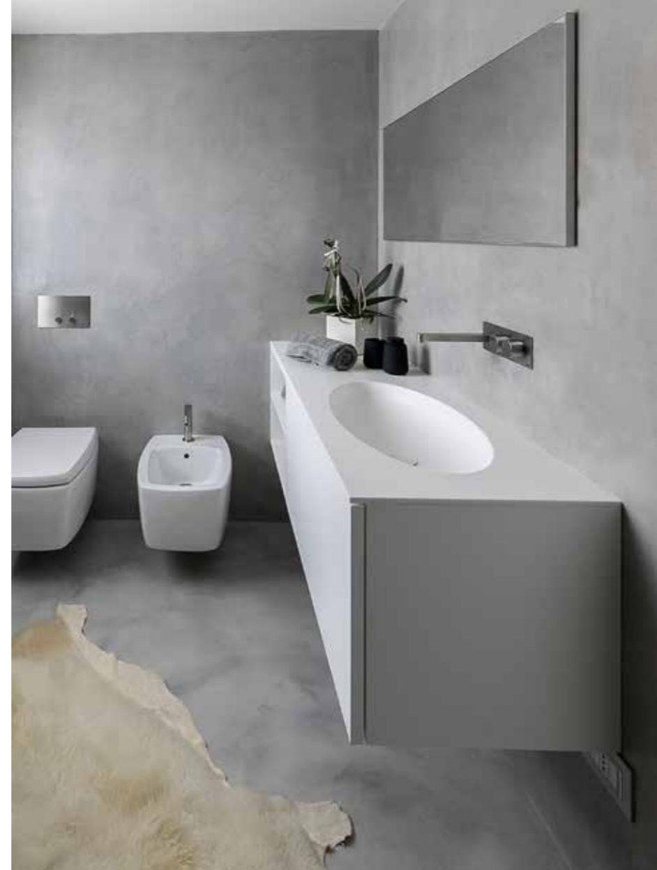
Inquadratura dei bagni di servizio, realizzati uno a piano terra, l'altro al piano superiore: nel primo, pareti rivestite in resina e piano in legno iroko; nel secondo, molto luminoso, rivestimento completo in resina grigia e mobile sospeso bianco. Sanitari e rubinetteria Boffi ( Zenucchi Arredamento ).