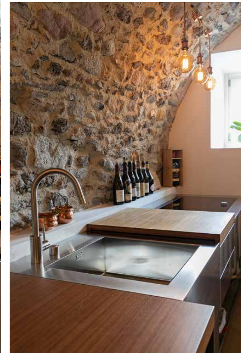
La cucina funzionale, moderna, interamente in acciaio inox, con piano in legno massello iroko, disegnata da Piero Lissoni per Boffi, s'inserisce perfettamente nell'atmosfera rustica dell'ambiente, intonandosi alle tonalità naturali delle pietre della volta (Zenucchi Arredamento).