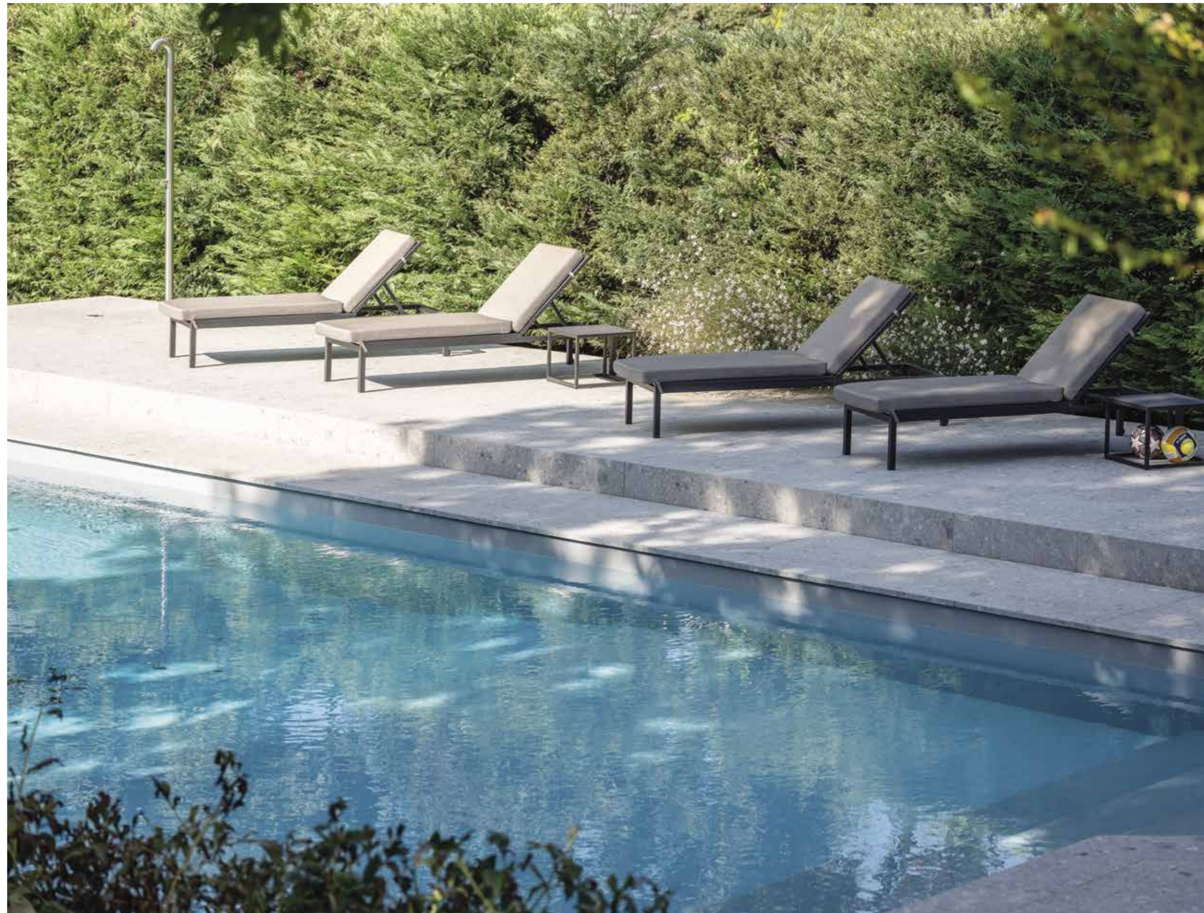
Gli spazi all'aperto rispecchiano lo stile distintivo degli interni: elementi in comune, la pavimentazione in Ceppo di Gré, utilizzata sia in terrazzo che a bordo piscina, e la scelta curata dell'arredo, come i dettagli del tavolo con sedute abbinata ( Zenucchi Design Code ).