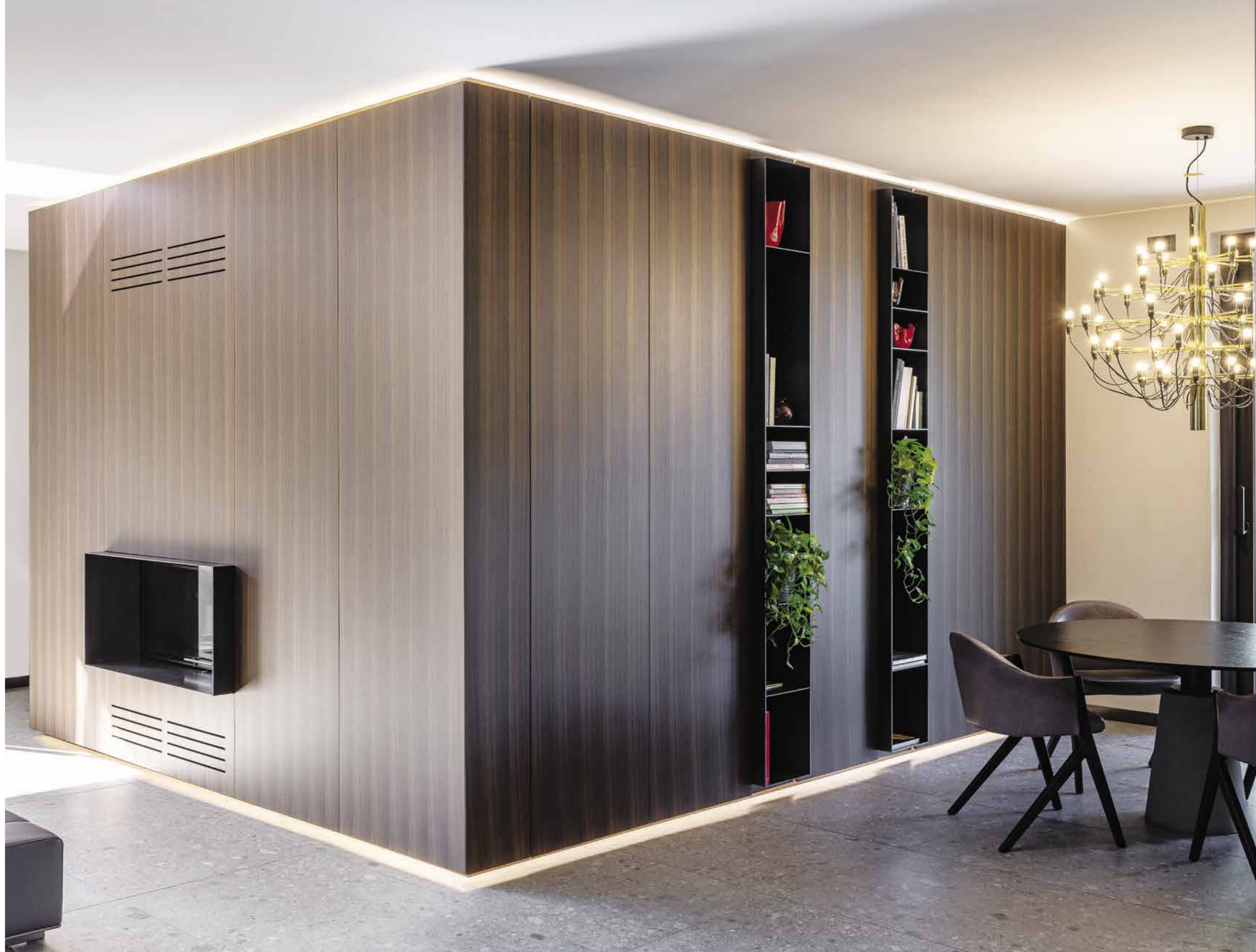
Tra il living e l'ingresso alla cucina cattura l'attenzione lo squadrato volume divisorio e contenitore, con camino, colonne a giorno in ferro e barre luminose, realizzato in legno su disegno. Al centro, tavolo da pranzo rotondo di Frau, con sedie di Cassina e luminoso lampadario di Flos ( Zenucchi Design Code ).