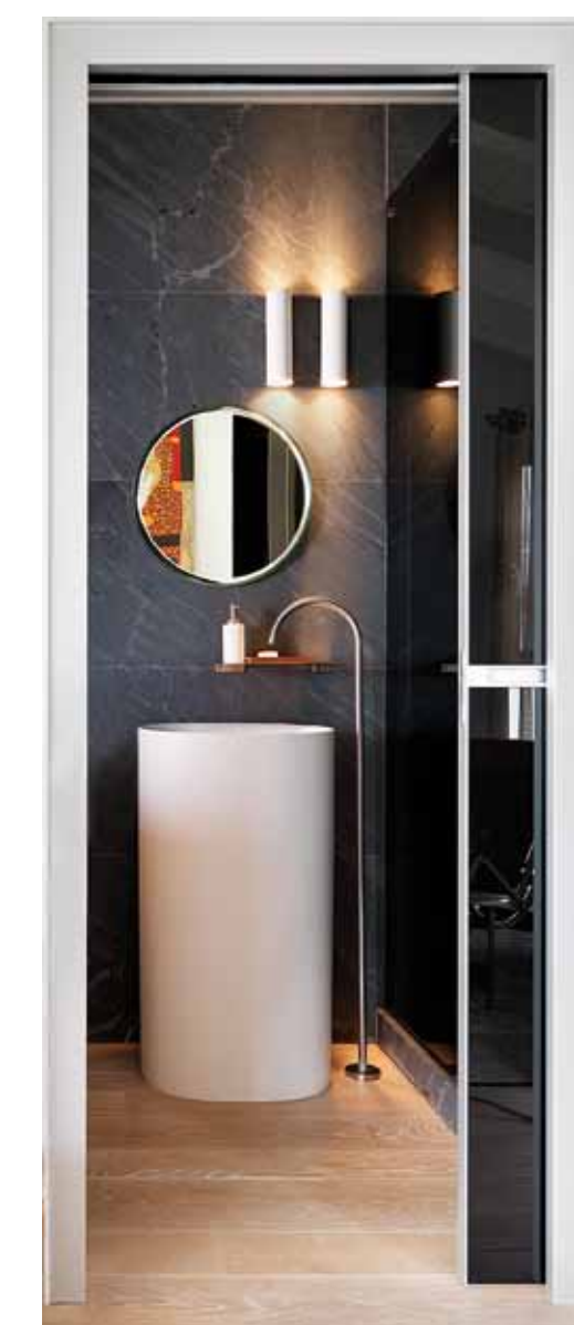
A lato: un letto rotondo rende armonioso lo spazio della camera padronale. Dalle finestre entra la luce e la vista meravigliosa circostante. Sopra: oltre agli arredi, Zenuchi Arredamento ha fornito tutto: dai rivestimenti orizzontali e verticali a rubinetteria, vasca, doccia, lavabi, sanitari e porte.