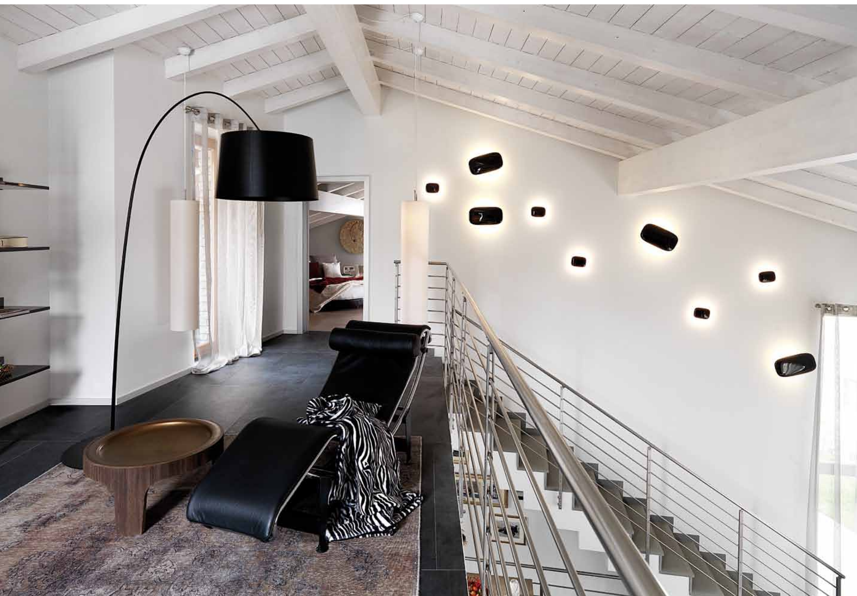
Un'istallazione di luci decora la parete della scala da cui si accede al soppalco. In primo piano l'area relax con chaise longue Cassina.