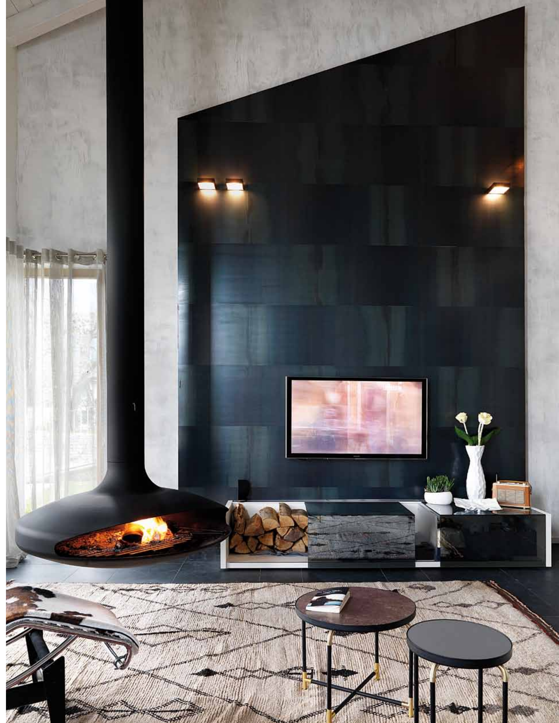
Soppalco e zona living dialogano grazie a un linguaggio di materiali comuni e a un design d'interni molto curato. A destra: il camino Focus e la parete in ferro sono due arredi che danno un tocco unico a questa splendida abitazione (progettazione d'interni Zenucchi Arredamento).