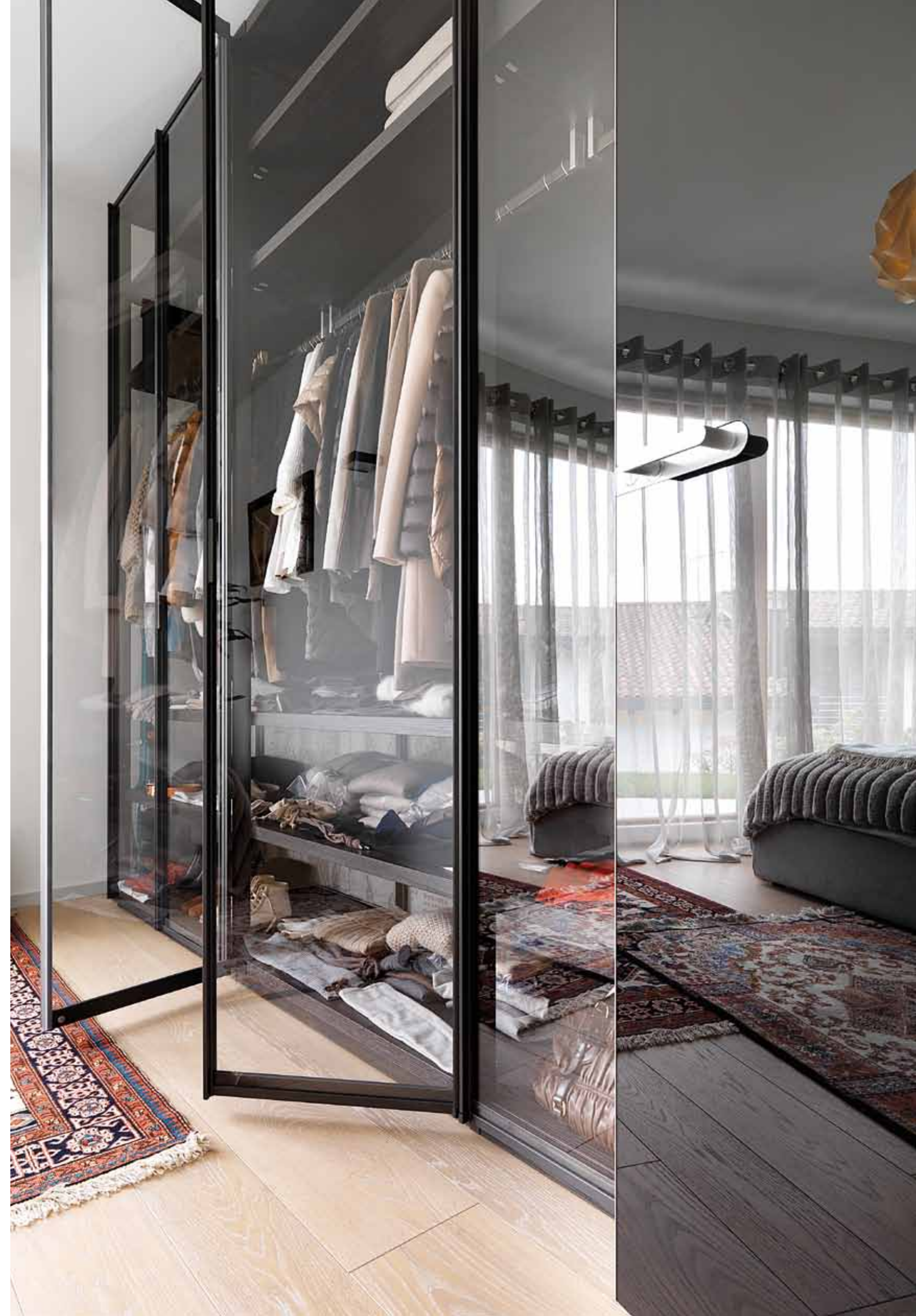
Sopra: la camera ospiti, posizionata al piano terra per consentire maggiore privacy. A destra: la cabina-armadio della camera ospiti. Il pavimento in rovere naturale riscalda l'ambiente (progettazione d'interni Zenucchi Arredamento).