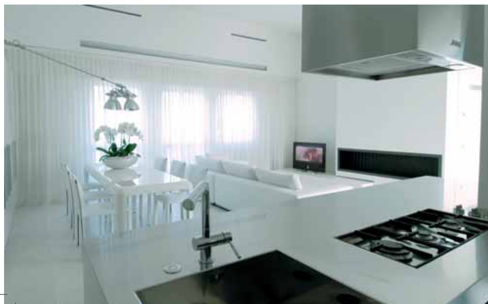
Cucina di Varenna, formata da un'isola in acciaio che abbraccia un pilastro, elemento strutturale volutamente allargato, dietro a cui sono disposti i colonnati con forni, il frigorifero, gli elettrodomestici e la cantina dei vini.

fila di palme nane di Cicas che suscitano l'impressione di trovarsi in un'elegante località della Costa Azzurra o qualche altro luogo di villeggiatura. Uno spazio sapientemente studiato e apparentemente più vasto dei suoi 50 mq, per vivere davvero l'esterno, distendersi, ricevere gli amici, creando situazioni diverse by day e by night, dalla festa in piscina dedicata ai più piccoli durante il giorno, alla cena immersa in una suggestiva atmosfera al calar del sole, ma sempre con la sensazione di essere in vacanza, 365 giorni l'anno. Contribuisce, a tal proposito, il ricercatissimo studio dei punti luce, collocati in modo da creare un'illuminazione d'effetto, diretta e indiretta. Il materiale scelto per il pavimento, pietra di Damasco sulle tonalità dei grigi e marroni, conferisce invece una certa prospettiva e profondità grazie alla posa rettangolare a casellario.