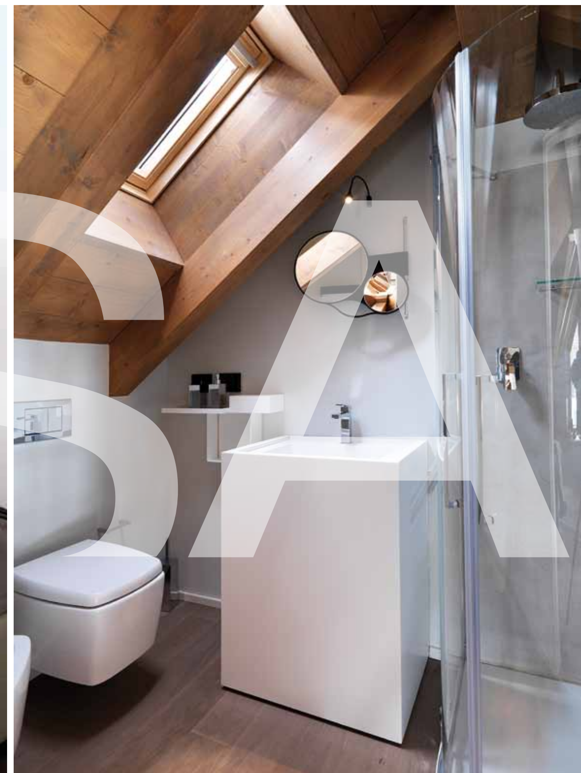
Design anche nella zona bagno: la ricerca degli arredi, le soluzioni d'interni, i rivestimenti sono stati studiati interamente su misura da Zenuchi Arredamento.