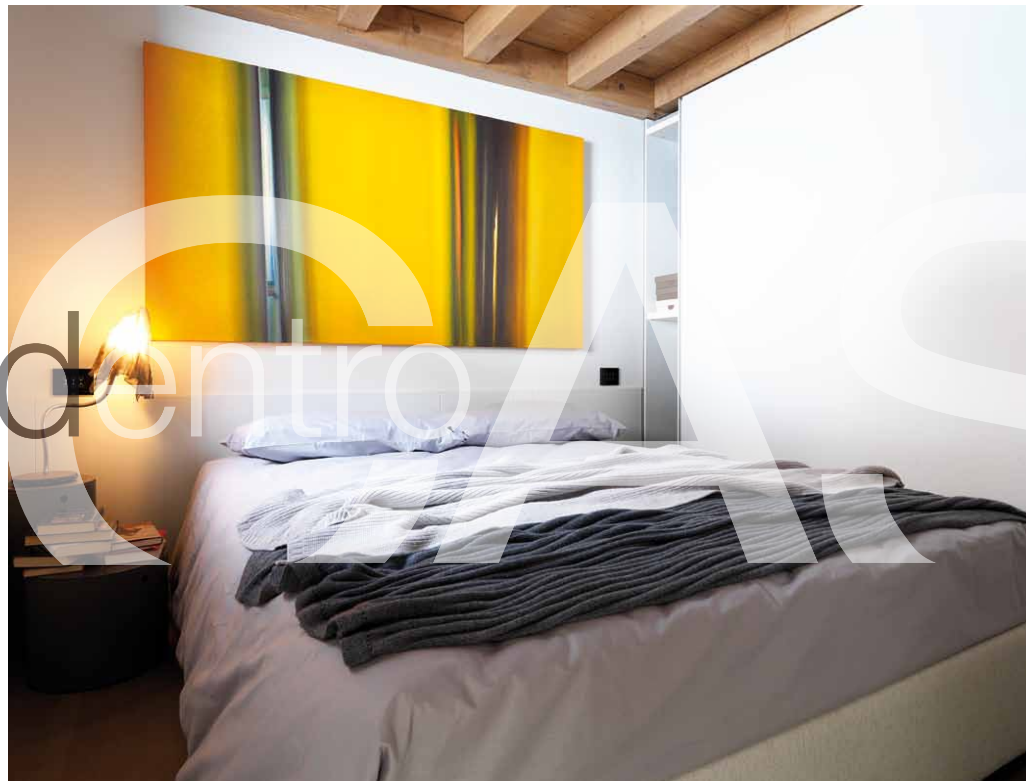
La camera degli ospiti, dove non può mancare design e comfort.