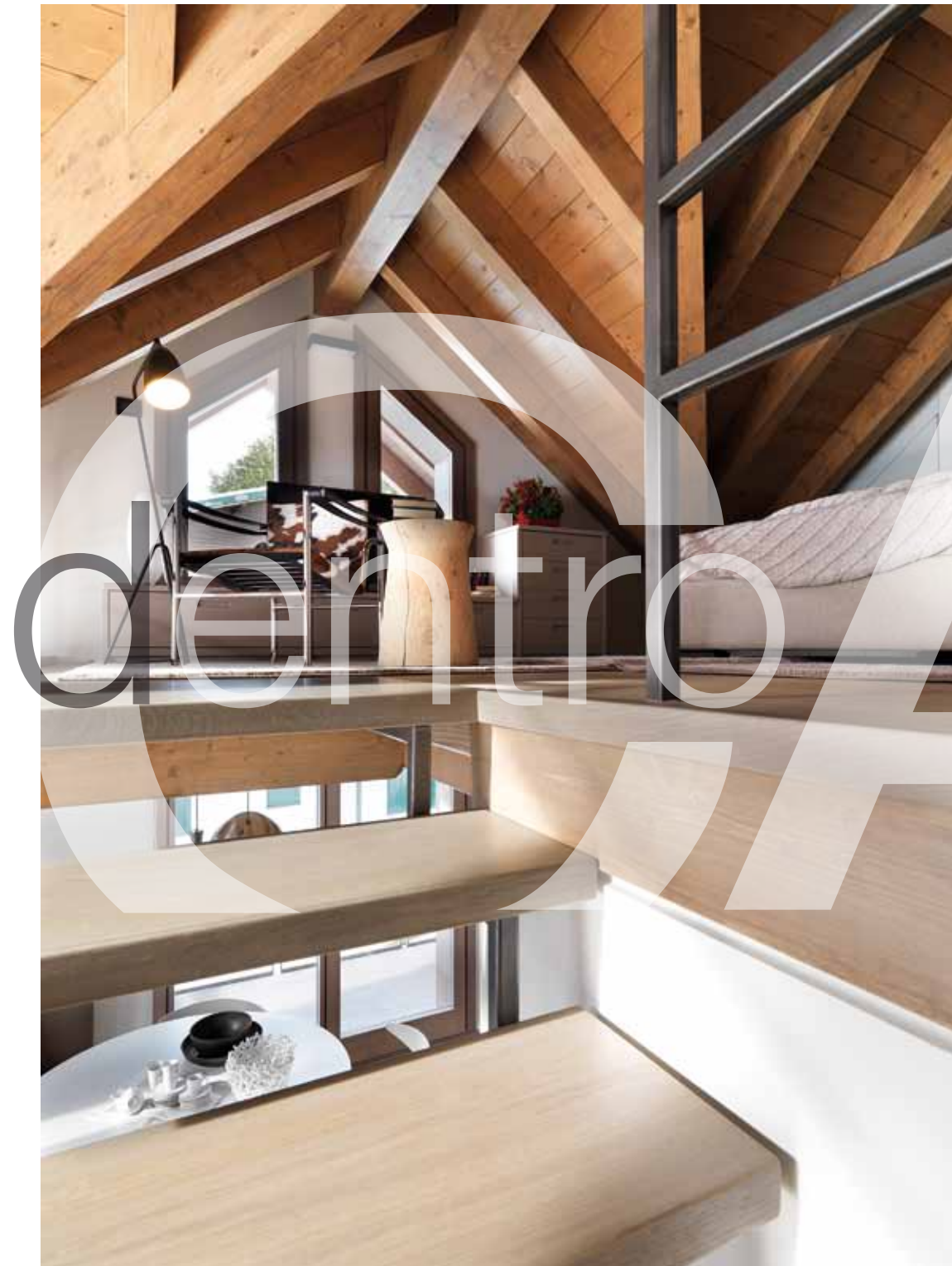
La scala ha una struttura in ferro crudo saldato in opera: i gradini sono tutti in legno tranne i primi quattro rivestiti in resina. Il primo funge da panca per la tv.