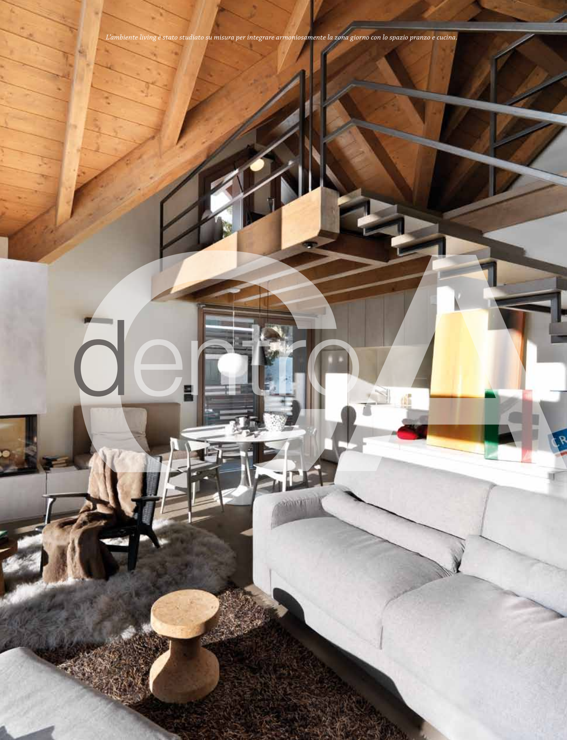
L'ambiente living è stato studiato su misura per integrare armoniosamente la zona giorno con lo spazio pranzo e cucina.