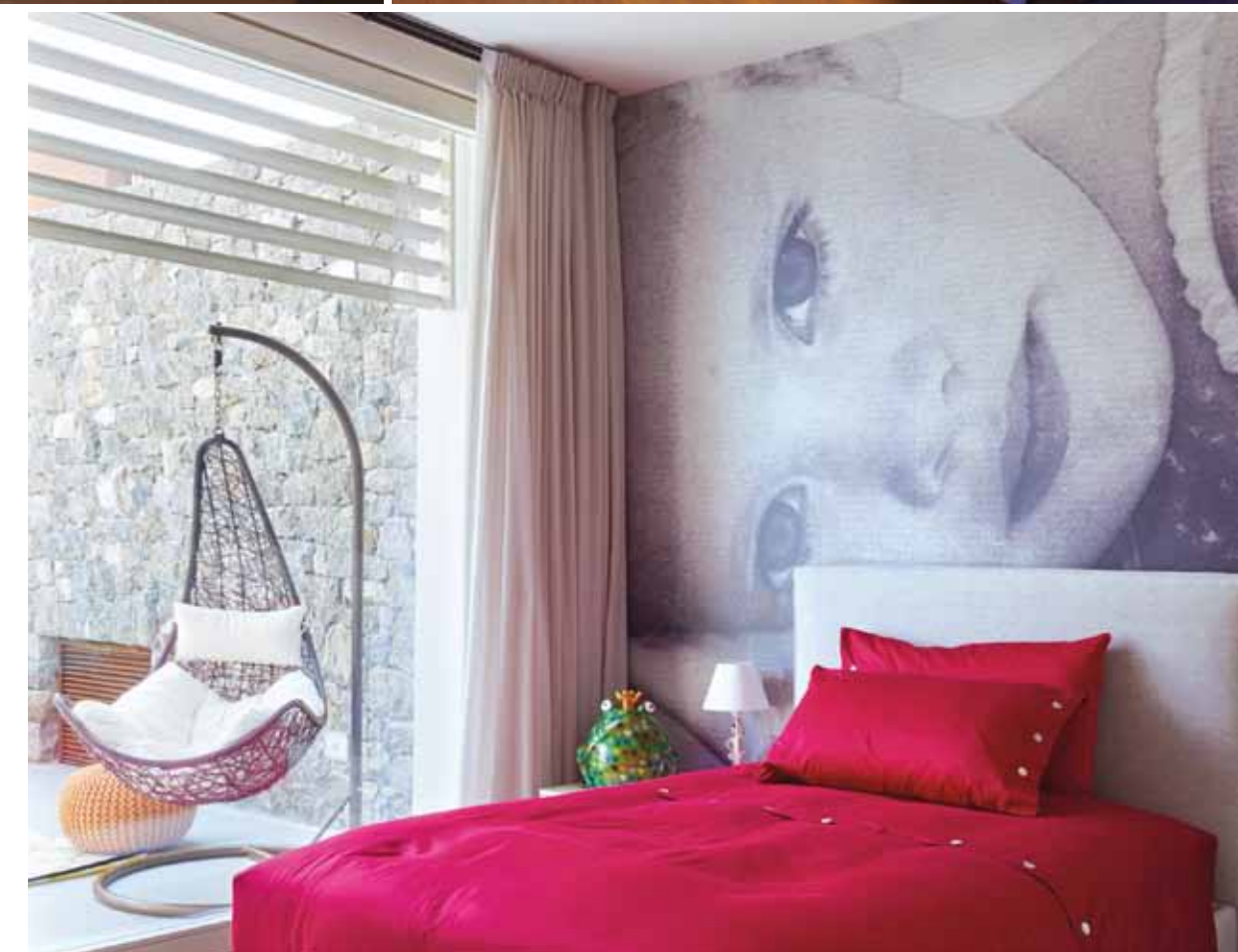
Sopra: dall'interrato, si slancia il pozzo di luce: uno spazio sviluppato in verticale su cui si affacciano i piano abitativi. La luce diventa un elemento scenografico che coinvolge anche gli spazi di transito. A destra: le camerette personalizzate con stampe sulla parete, vivaci e colorate, completate con morbidi letti imbottiti (Zenucchi Arredamento). Sono inoltre serviti e da un bagno di pertinenza.