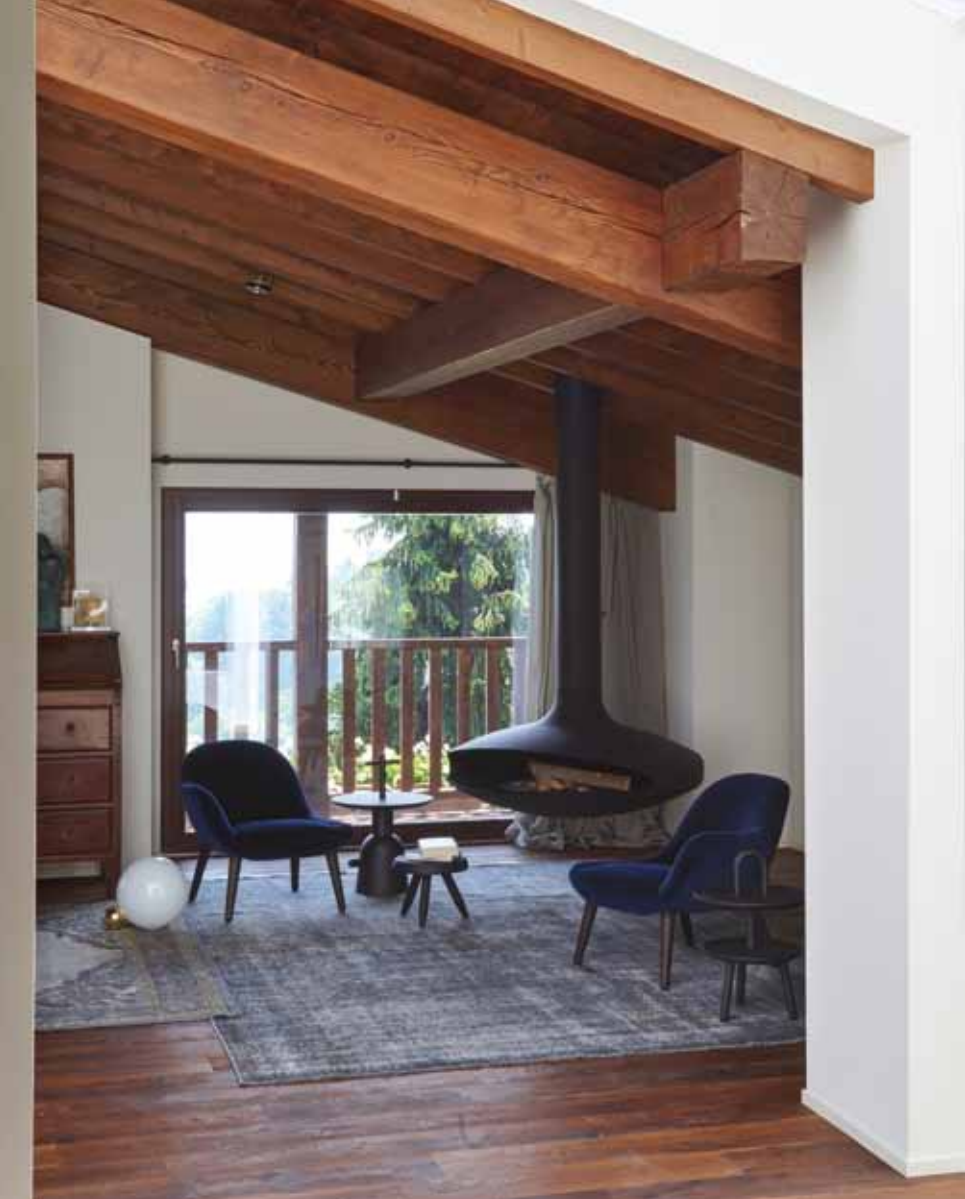
A sinistra: uno scorcio affascinante della casa: da questa immagine si leggono alcuni strati abitativi che raccontano con originalità e rispetto del sito originario la vita "nuova" di un cascinale. Scultura di Bruno Lucchi. Sopra: la struttura vetrata è il nuovo ponte di unione tra progetto originario e presente. L'architettura è stata studiata pensando a un'integrazione totale con il paesaggio esterno. Nell'immagine di destra poltroncine in velluto e camino sospeso Focus (Zenucchi Arredamento).