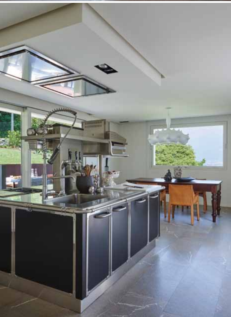
La cucina industriale è stata realizzata su misura, in acciaio inox. Le colonne (Varenna) accolgono anche un elemento operativo funzionale (Zenucchi Arredamento). Cucina e soggiorno comunicano l'uno con l'altro attraverso la struttura vetrata progettata dall'architetto Gian Paolo Cassone. Un dialogo fra antico e moderno.