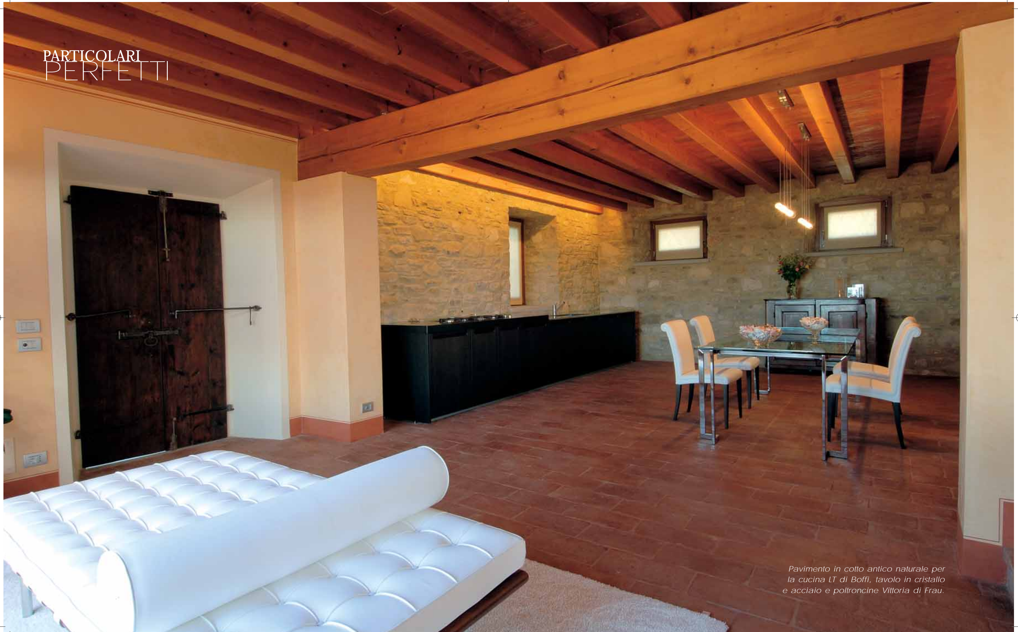
Pavimento in cotto antico naturale per la cucina LT di Boffi, tavolo in cristallo e acciaio e poltroncine Vittoria di Frau.