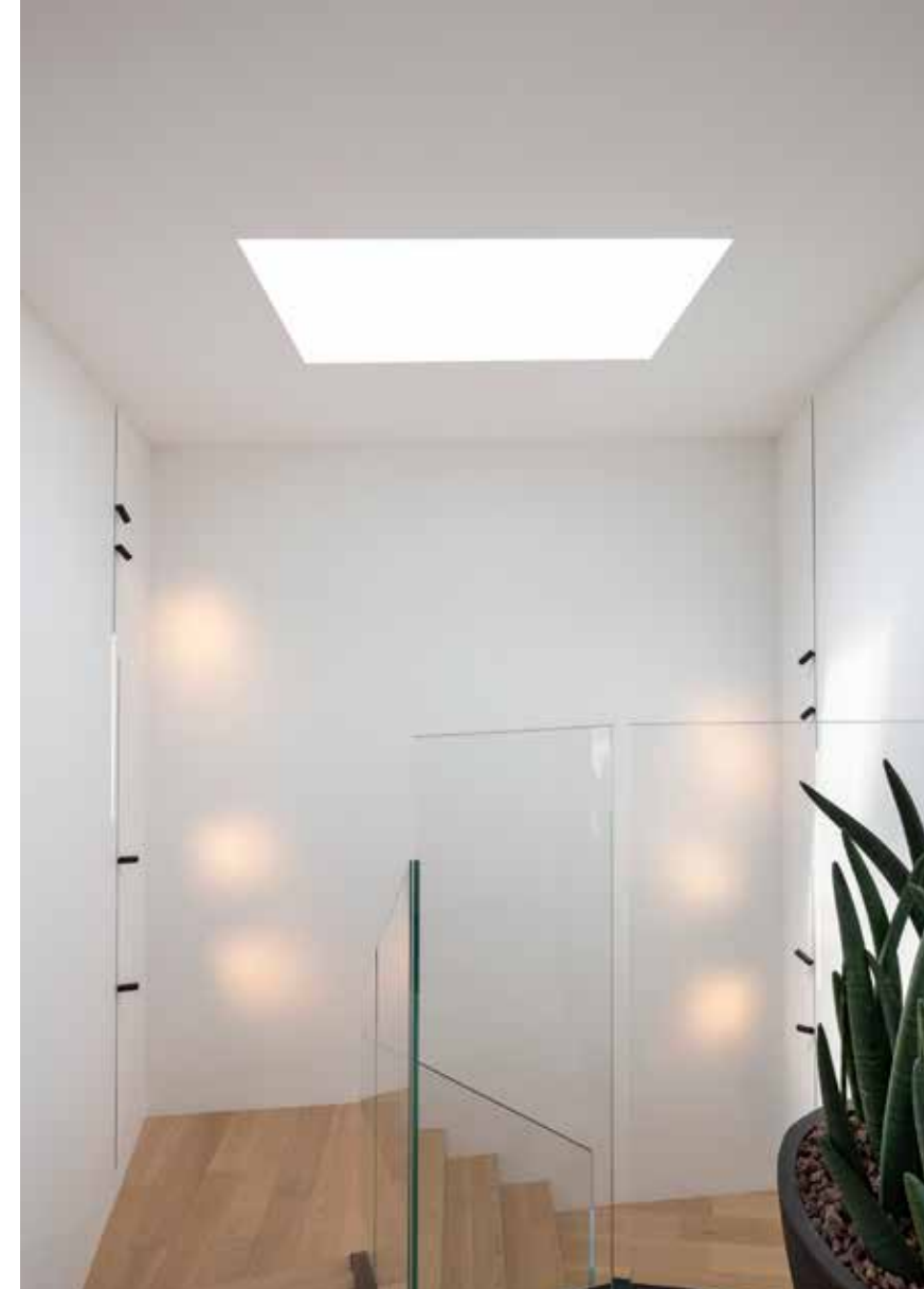
Molto particolare e suggestivo lo studio dell'illuminazione delle scale creato da binari verticali incassati di Flos con spot e light strip (Zenucchi Arredamento).